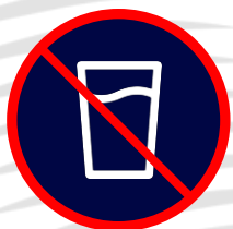
Verres / Bouteilles / Canettes Boissons alcoolisées