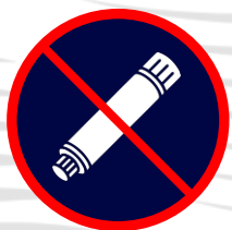
Articles pyrotechniques & matériels explosifs