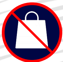
Sacs plus grands que 25 x 25 cm