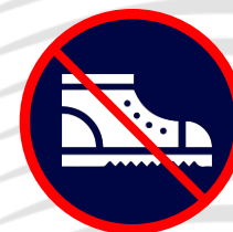
Chaussures de sécurité