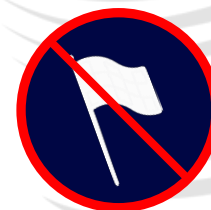
Hampe rigide, les fagots de drapeaux