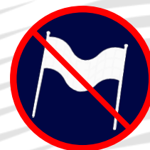
Banderoles – messages injurieux, politiques, racistes, idéologiques, philosophiques, publicitaires