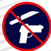
Couteaux / armes