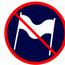
Banderoles - messages injurieux, politiques, racistes, idéologiques, philosophiques, publicitaires