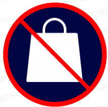
Sacs plus grands que 25 x 25 cm