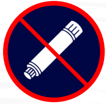
Articles pyrotechniques & matériels explosifs