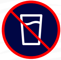
Verres / Bouteilles / Canned Boissons alcoolisées