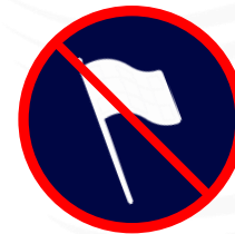
Hampe rigide, les fagots de drapeaux