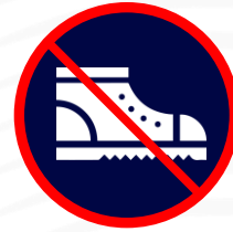
Chaussures de sécurité