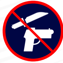
Couteaux / armes